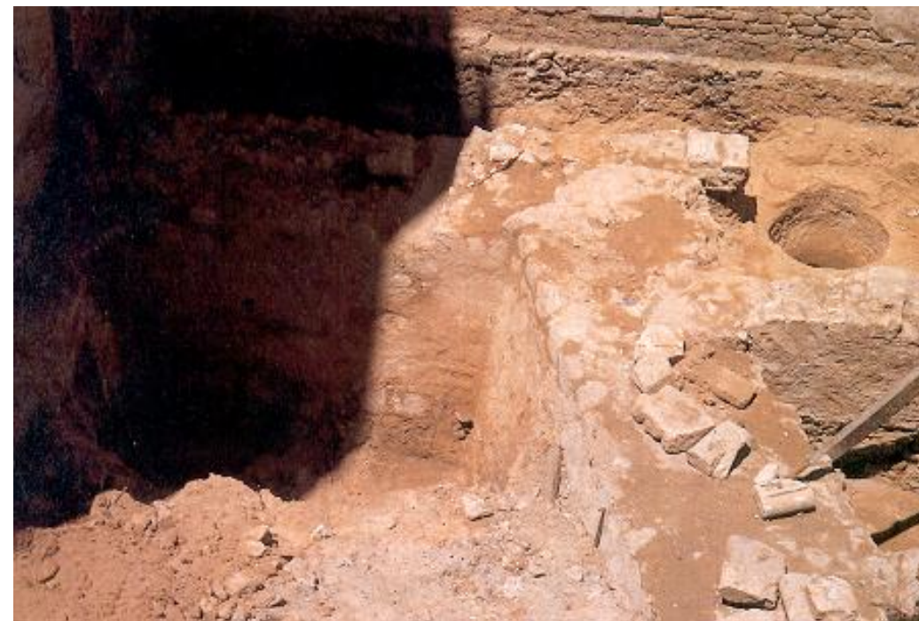
VISTA GENERAL DE LA MURALLA E INICIO DEL BALUARTE DE LA PUERTA DE SAN FRANCISCO.